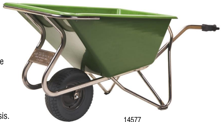
14577 M-NOKA 160-CTWB PP ALU

Roue anti-crevaison plus large (pneu en mousse Polyuréthane).