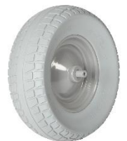
17044 M-800-CT WB plus large