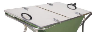
10417 M-COUVERCLE NOKA 160 aluminium en option