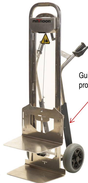
Guide de protection