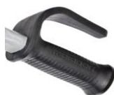
12337 Poignée Ergo avec garde de protection