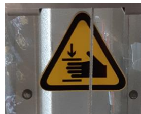
Protection plexiglas pour protéger les mains

Équipé de roues increvable en mousse polyuréthane.