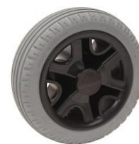
10189 Roue increvable