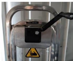
Manivelle avec blocage anti-retour