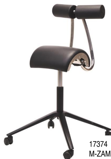
17374 M-ZAMI BCKSTR