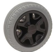
10189 Lekvrije band (opgeschuimd polyurethaan)