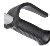
12337 Veiligheidshandgreep met knokkelbescherming