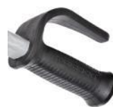
12337 Ergonomische natuurrubberen handgreep met knokkelbescherming