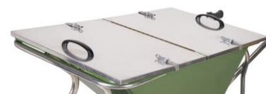
10417 M-DEKSEL NOKA 160 aluminium (optioneel)