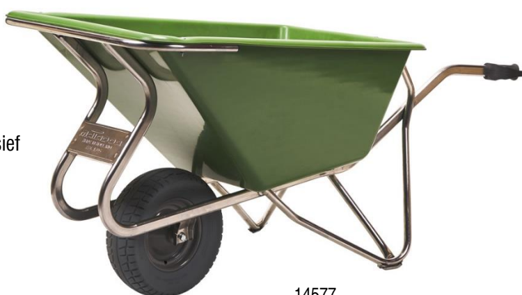
14577 M-NOKA 160-CTWB PP ALU

Voorzien van extra brede lekvrije PU-band (opgeschuimd Polyurethaan).