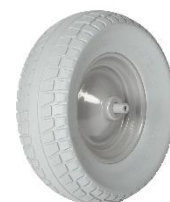
17044 M-800-CT WB extra breed