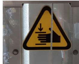
Plexiglas bescherming om o.a. de handen te beschermen