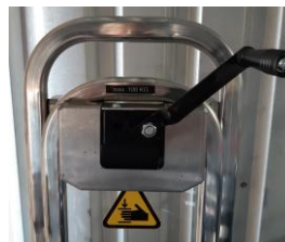
Ratel met terugloopblokkering