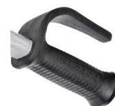
12337 Sicherheitshandgriffe mit knöchelschutz