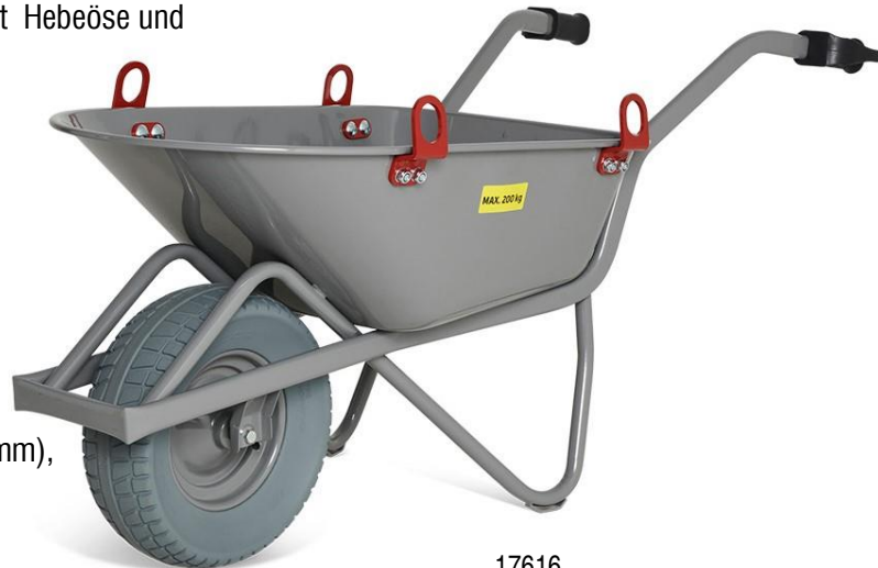
17616 M-115-CT-WB Hebeöse