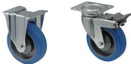
13533 Roues fixe